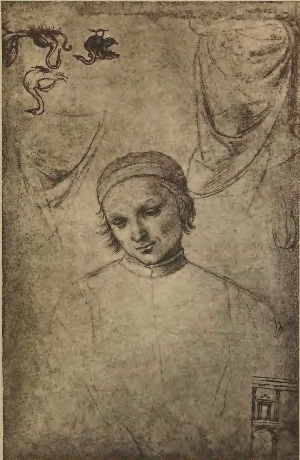
Plusieurs études — Envers du dessin précédent